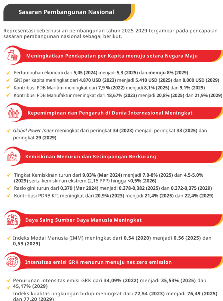
Gambar 3.1 Sasaran Pembangunan Nasional RPJMN Tahun 2025 - 2029

Sasaran pembangunan menggambarkan kondisi yang diharapkan dalam mencapai penurunan kemiskinan, peningkatan kualitas sumber daya manusia, dan pertumbuhan ekonomi tinggi berkelanjutan. Kondisi yang diharapkan juga diperkuat dengan sasaran pada aspek politik luar negeri dan lingkungan. Pencapaian sasaran pembangunan nasional tahun 2025–2029 merupakan manifestasi dari penguatan transformasi menuju Indonesia Emas 2045. Adapun sasaran pembangunan nasional tahun 2025-2029 yakni :